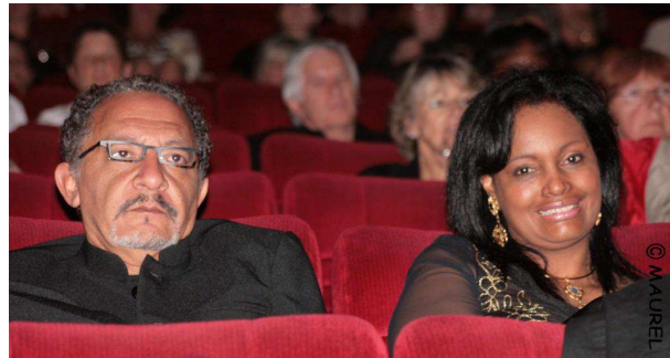
Joel Zito (réalisateur Brésil – FIFP 2008)

Un Monde Ethique est possible. Plus qu'une affirmation, c'est un cri du cœur, celui poussé par des milliers de citoyens du monde responsables. Ils croient plus que jamais qu'un Monde meilleur basé sur les valeurs de Vie est possible.