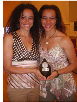
Les sœurs Phyllis (Productrices de The Inévitable Undoing of Jay Brooks – Dikalo Award )

Comme les années précédentes les meilleurs longs métrages, documentaires et courts métrages vont concourir pour le Dikalo Award.