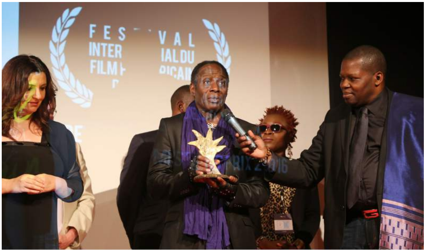
Sidiki Bakaba recevant son Dikalo Award