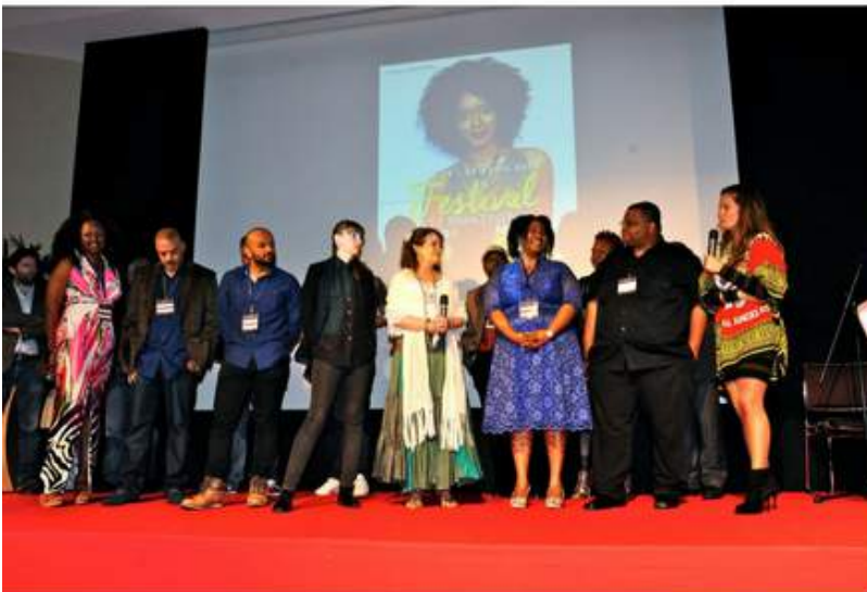
Présentation des réalisateurs & producteurs de films