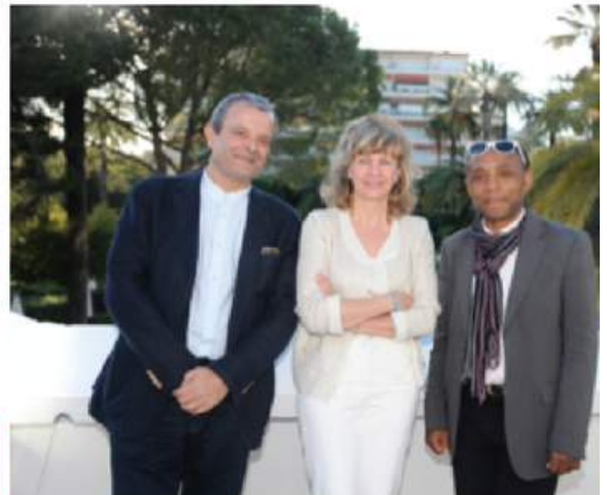
De gauche à droite

Les artistes & les créateurs ont l'occasion de s'exprimer lors du FIFP